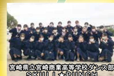
宮崎県立宮崎商業高等学校ダンス部 SKULL☆PUNCH