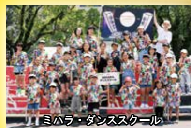
ミハラ・ダンススクール

●ご来場記念品プレゼント! (株式会社NPK提供) ※数に限りがあります。無くなり次第終了となります。